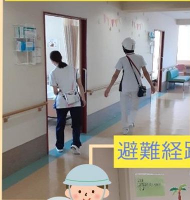
避難経路 安全確認